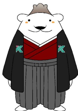
鹿児島大学公式マスコットキャラクター