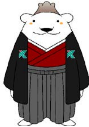
鹿児島大学公式マスコットキャラクター