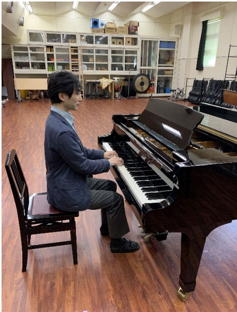
[右手が手前にくる場合の撮影例]