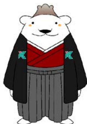
鹿児島大学公式マスコットキャラクター