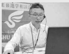
アドミッションセンターの教員が相談に応じます。

※この相談会は、一般選抜、学校推薦型選抜及び総合型選抜の相談会です。それ以外の入試については、各学部の入試事務室へお問い合わせください。