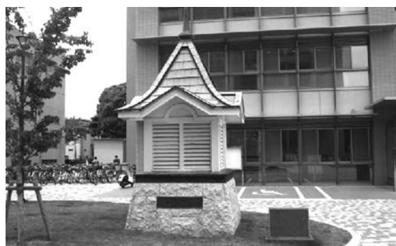
薬学部のシンボル「屋根飾り」

修士課程には、薬学に関連があるものとして総合薬品科学専攻がおかれています。博士課程は、後期3年課程（先端創薬科学専攻）と4年課程（先端医学薬学専攻）がおかれています。