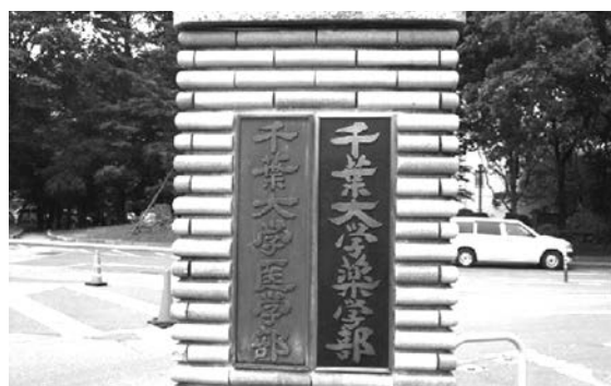
亥鼻キャンパス旧正門