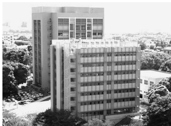
医薬系総合研究棟Ⅰ・Ⅱ

本学薬学部は、薬剤師免許を取得して医療の現場や公衆衛生の分野で指導的な立場に立てる薬剤師及び臨床開発職の人材養成を目的とする6年制の薬学科と、創薬に関する研究・教育職や開発職の人材の養成を目的とする4年制の薬科学科から構成されています。一括募集による入学者（前期日程の入学者）の場合、3年進級時に、6年制の薬学科と4年制の薬科学科のいずれかを各自の志望・成績により決定します。薬学科は、薬剤師免許を取得して病院、調剤薬局又は公衆衛生の領域で指導的な立場に立てる薬剤師及び臨床系の開発・治験を通して医療に貢献できる人材の養成を目的とします。薬科学科は、4年間の薬学基礎教育に加えて原則として大学院修士課程2年間の少数精鋭の薬学研究教育を経て、創薬研究や医薬品開発に大きく能力を発揮できる人材の育成を目的としますが、臨床に関連した分野での活躍も可能です。